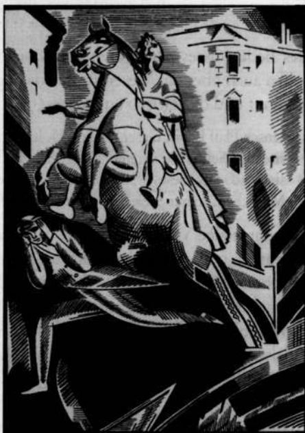
Abb. 3 und 4. Alexander Puschkins Gedicht »Der Eherne Reiter« im Berliner NWA Verlag 1922, illustriert von Wassilij Masjutin